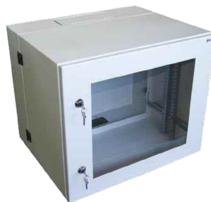
NRS-2-IP-55-19" - widok od frontu