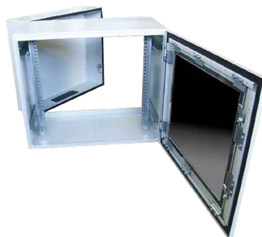
NRS-2-IP-55-19" - widok od frontu po otwarciu