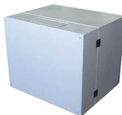
NRS-2-IP-55-19" - widok od tyłu