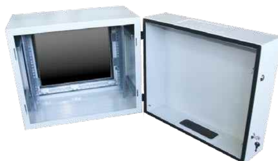
NRS-2-IP-55-19" - widok od tyłu po otwarciu