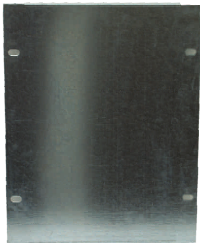
Płyta Montażowa do obudów ZK