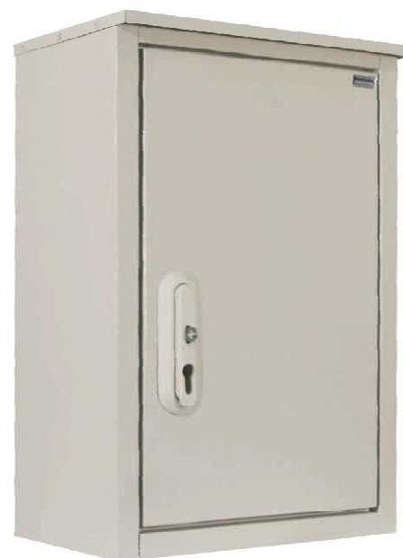
Obudowa Złącza Kablowego z blachy ocynkowanej lub aluminiowej